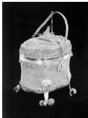
图1 法门寺地宫出土的金银丝结条银笼子

综上所述,晚唐到五代文人阶层的社会地位较低,文人在理想破灭和仕途失意的打击中开始逃避现实,从生活方式到审美情趣都受到了佛老思潮的影响。由于信奉“师法自然”,文人在茶具的选择上多以日常生活用具为主,不需要任何的人工装饰,这