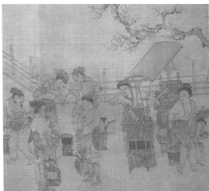
图5 刘松年《茗园赌市图》

经过长时间的发展,到宋代末期,编织茶具的美感已经被大部分茶人所接受。宋末元初的画家赵孟頫、钱选所作的画作都有大量竹编茶具出现。