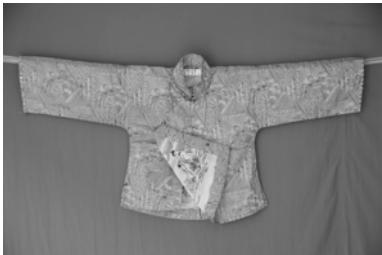
图 4 印花女袄(江南地区)

对江南大学民间服饰传习馆馆藏的齐鲁地区 33 件女袄进行分析,其中绣花装饰的有 25 件,占总装饰类别的 75%,以寄予美好愿望的吉祥图案为多,如“蝶恋花”“暗八仙”与“花开富贵”等。而“暗八仙”的广泛应用,“可能与历史传说中的蓬莱仙境有很大的渊源,这里的民间刺绣工艺独树一帜,俗称‘鲁绣’” [1]34 。相对于鲁绣,江南一带女袄上的刺绣工艺更为精细。其分布位置与鲁绣比较集中于女袄的领口、袖口和下摆处不同,而是较多分布于女袄的前襟两侧,仿佛将前衣片作为一个画面来作刺绣装饰,面积较大但花卉形态较简洁。