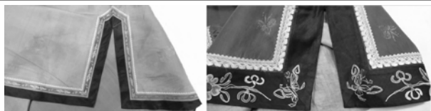
图 5 齐鲁地区的镶沿与花边