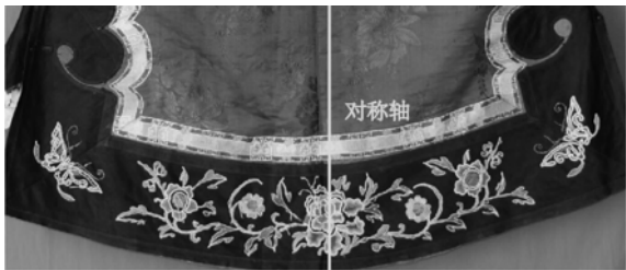
图 1 齐鲁地区绣花大袄图案纹样

“对称即左右相等排列” [2]320 。对称式给人稳定、端正的感觉。江南大学民间服饰传习馆馆藏齐鲁地区的女袄,多以对称绣样装饰于衣身,如“蝶恋花”“暗八仙”等,无不寄予了美好的愿望。其中两件典型绣花大袄(如图 1、图 2),在前襟下摆处采取对称结构,以女袄前襟中心线为对称轴,中间安排完整的花卉或吉祥纹样,两边依次为花和蝴蝶的单独纹样,左右相等排列。内容活泼多样,但形式上则规整统一。