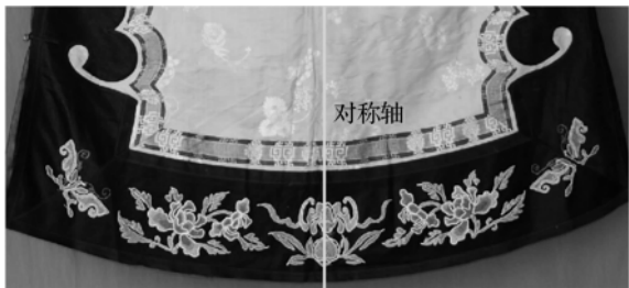
图 2 齐鲁地区绣花大袄图案纹样

呼应式的装饰形式追求的是整体的协调感,通过彼此关联,相互配合,形成富有情趣且造型活泼的风格特点。而此装饰形式更被广泛应用于民间服饰中。