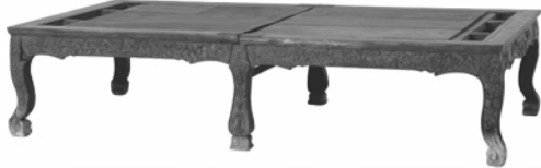
图3 故宫博物院收藏的明黄花梨折叠床 (二)凭依类

“眠床”为出游时睡觉用，平时折叠收起成箱，是为折叠床。明代晚期文震亨《长物志》中提到的“永嘉、粤东有折叠者，舟中携置亦便”是关于折叠床的记载。故宫博物院收藏的明代黄花梨折叠床(图3)，可折叠相合，腿装有金属转轴，能随时支起或放倒，于出游使用，非常具有实用功能。 [5]