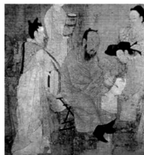
图 1 胡床(北齐校书图局部)

胡床(图 1)是一种便携坐具,可放可收,易于携带,易置于车、船内,是马扎的始祖。它由八根板条构成,两根横撑在上,用绳穿成座面;两根下撑为足,中间各两根相交叉支撑,相交处以卯钉穿心为轴。最早记载“胡床”是汉代应劭的《风俗通》,《风俗通义