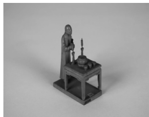
图2 诵经供养 ①

晚清以来,算卦占卜、风水看相和求神保佑的习俗甚为普遍,百姓还通过祭拜先祖或宗教偶像以祈求福运。土山湾孤儿工匠们围绕民间信仰,对神话传说、佛教、道教人物进行创作,如蚌精、和尚、道士、卜卦先生、牛头神等。图2呈现的是木雕人偶正在对神龛进行祭拜,这是民间祭拜方式之一。