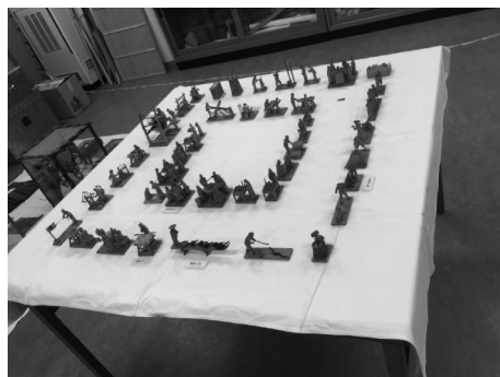
图1 日方藏品土山湾木雕人偶“世间百态”

从材质看,日方藏品为黄杨木与小白木结合的木雕作品,无着色,表面光滑。当时日方以商品形式订购了“世间百态”这一作品,用于天理参考馆的展览,这也是已知的当时最大规模的黄杨木雕作品。法方“世间百态”藏品,未做上蜡上漆处理,部分藏品有明显着色,从材质看似多用小白木,相比之下,日方藏品无论是细节刻画还是材料使用方面都更讲究。