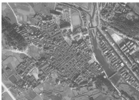
图7 以合院为主的单元细胞形成规律性的空间肌理①

顺势而生的天井成为居住单元的核心,虽然边界是封闭的,而内院是开敞的。“间”是最基本的空间单位,面宽通常为3~4 m,进深为5~10 m。这种以“间”为单位发展而来的合院模式,成为丽水地区传统的住宅形态,也成为构成肌理的基本单元细胞。它们有秩序、有规律地重复、排列、组合,形成规律性的空间肌理,构成了村落肌理的整体形象(图7)。