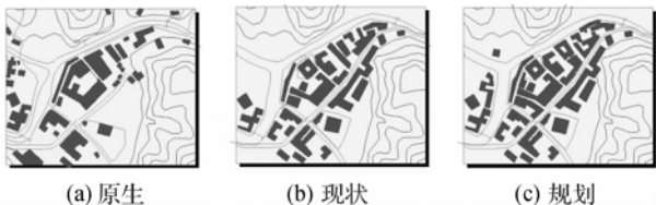
图8 村落规划前后肌理对比

贝聿铭指出,在老城区建造建筑,应当尊重原来的组织结构,像织补织物一样 [2]23 。在规划设计时需要保护好现有建筑,对村落原本的肌理形式进行分析和利用,保留街巷格局。我们曾经尝试以源底村做实验性的设计,根据其原生肌理形式与现状肌理形式的对比,找出两者之间的关系和发展规律,在维持现状密度与形态的基础上,进行肌理的修补(图8)。对于现状保存较好,风貌特征显著或具有重要历史意义的建筑,应采用复原式修复,做到整旧如故;对一些影响肌理形态的建筑进行更新或整治,使村落的传统风貌保持完好;对与历史风貌有较大冲突的不协调建筑和障碍建筑、违章搭建或以后加建的、破坏原建筑布局和历史地段空间形态的建筑,应该采用拆除的方式。