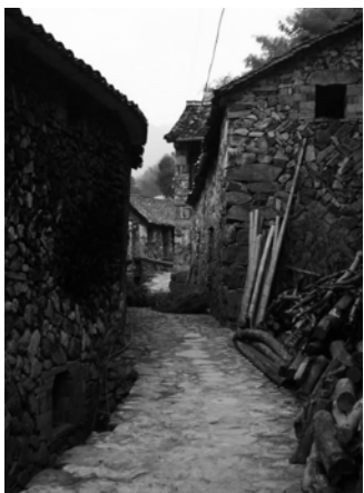
图4 岩下村的石头材质街道

丽水的历史文化村落在自然地形上有高山阶梯、高山台地、平谷、傍水的区别,村落布局也基本顺应自然地形地貌,因此在肌理形态上会表现出几种模式,比如散点式、街巷式、组团式和条纹式 [6]12 。而在这些模式之下,再加上阴坡、阳坡、峡谷、山脊等小地形差异而使肌理显现出了自己的语言特点。虽然村落的基本单元是近似的,色彩、质地的特性与变化却使得村落的肌理表现出不一样的效果,共性中隐藏着个性。比如缙云县岩下村以其条石建筑闻名,因村附近没有粘的黄泥土,却多石头,建筑墙体多为山石垒筑,用材简洁粗犷,甚至路面、台阶、桥梁等全是就地取材,清一色用石头建成。村内道路狭小,呈现网络状,亦多为石块铺砌,而块石间有色彩差异,使得村落肌理表现出了独特的地域特点(图4)。