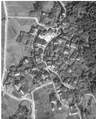
图3 建筑的组织 ①