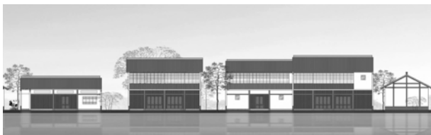
图10 保留原有肌理特征的立面设计