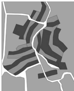
图2 肌理脉络和走向的形成