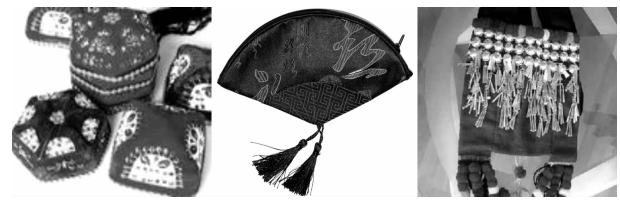
图2 新疆民族帽、苏绣零钱袋和少数民族挂包给人不同的触觉效果

化,对于游客有着独特的吸引力。这种特色必然对染织旅游纪念品的内涵、生产工艺等产生影响,从而使染织旅游纪念品带有浓厚地域文化色彩 [2] 。染织旅游纪念品的文化内涵的地域性,是其能形成特色的关键和基础。