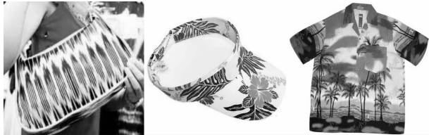
图 1 新疆民族手提包、海南遮阳帽和 体恤衫的视觉效果

品给人的第一印象。染织纪念品的图案设计和色彩的运用都与其本身的功能、款式、材料、工艺以及社会文化、审美观、时尚流行、消费对象等因素紧密关联 [1] ,可以说,染织纪念品的视觉特征直接体现了其文化的内涵与魅力。